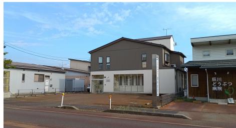
【えんどう歯科医院】