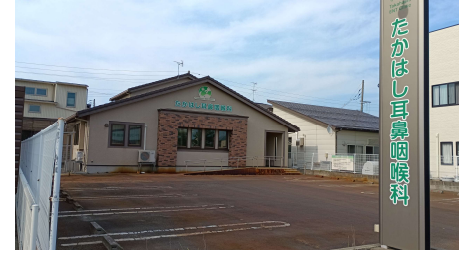
【たかはし耳鼻咽喉科】