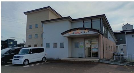
【しんこどもクリニック】