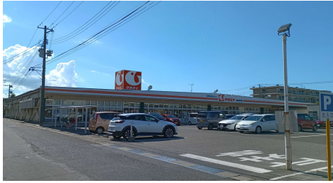
【スーパー ウオエイ】